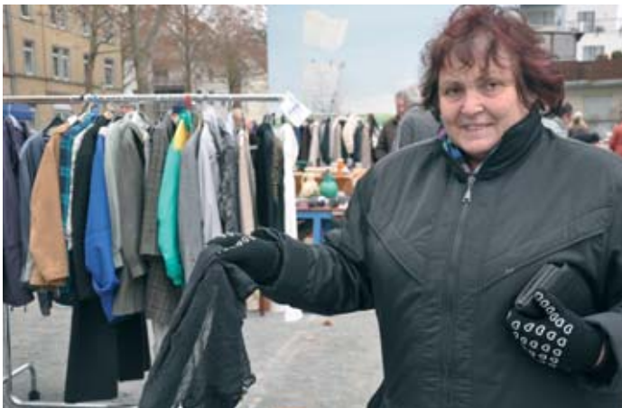
Hat das perfekte Krähen-Tuch im Angebot: Die Flohmarkt-Händlerin auf dem Stock-Platz.

Eine günstige Alternative ist der DRK-Kleidermarkt vom Deutschen Roten Kreuz. An der Haltestelle Wiener Straße muss man nur durch die bunte Unterführung an der Tankstelle vorbei und