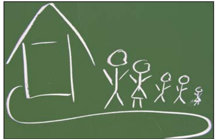
Lebensraum für Kinder und Anlaufstelle für Eltern: Das neue Kinderhaus.